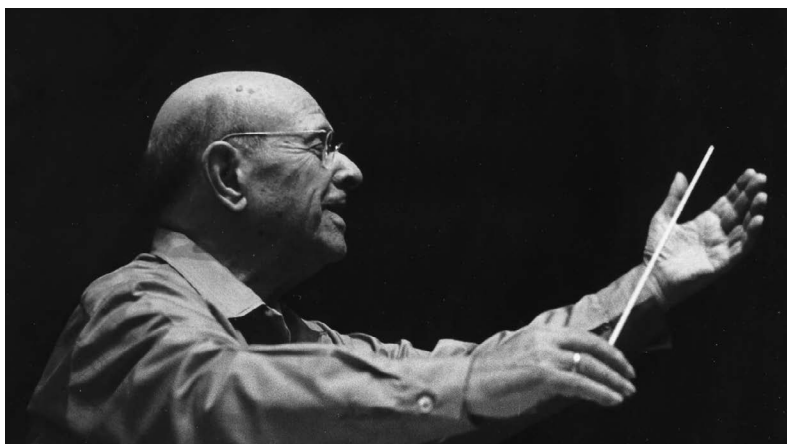
Pau Casals dirigint un assaig del Festival de Puerto Rico, c. 1965.

D'aquesta manera, la cantata manté viva la inspiració de Casals i la projecta cap al futur com un compromís amb la cultura, l'humanisme i la convivència.