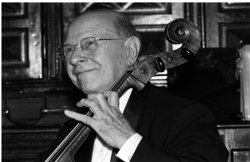
Pau Casals al Festival de Prada de Conflent, 1964.

Aquesta commemoració ha estat declarada oficial per la Generalitat de Catalunya i reconeguda com a esdeveniment d'excepcional interès públic pel Govern d'Espanya.